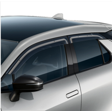
Vėjo deflektoriai (priekis ir nugara) Kaina - nuo 232€ Mėnesio įmoka nuo 3€/per mėnesį