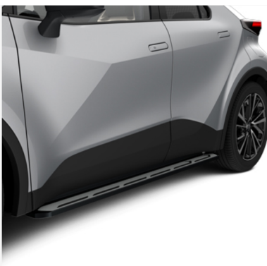
Šoniniai laipteliai Kaina - nuo 1351€ Mėnesio įmoka nuo 20€/per mėnesį