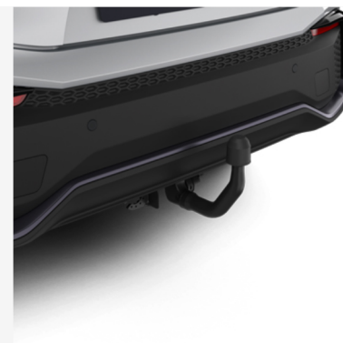
Nuimamas vilkimo kablys (vertikalus) Kaina - nuo 1373€ Mėnesio įmoka nuo 20€/per mėnesį

Į kainą įeina PVM ir montavimas, išskyrus žieminės padangas su lengvojo lydinio ratlankiais, kurių montavimo mokestis taikomas atskirai. Kainos skirtingose atstovybėse gali skirtis. Norėdami patikslinti dėl turimos papildomos įrangos ir kainų, kreipkitės į artimiausią Toyota atstovybę. Mėnesinė įmoka už papildomą įrangą galioja ją įsigyjant kartu su nauju automobiliu.