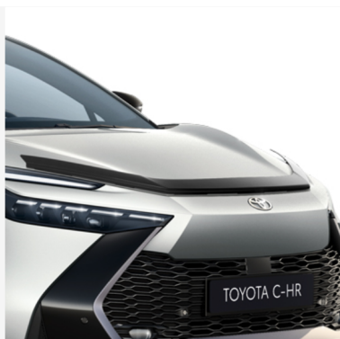
Variklio dangčio deflektorius Kaina - nuo 231€ Mėnesio įmoka nuo 3€/per mėnesį