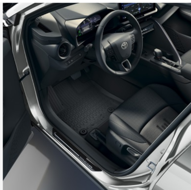
Grindų kilimėliai aukštais kraštais Kaina - nuo 109€ Mėnesio įmoka nuo 2€/per mėnesį