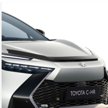
Variklio dangčio deflektorius Kaina - nuo 244€ Mėnesio įmoka nuo 4€/per mėnesį