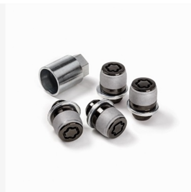
Rato užrakto veržlė Kaina - nuo 87€ Mėnesio įmoka nuo 1€/per mėnesį