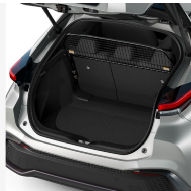
Pertvara šunims Kaina - nuo 516€ Mėnesio įmoka nuo 8€/per mėnesį