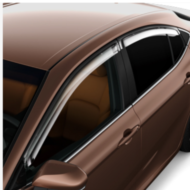
Vėjo deflektoriai (priekis ir galas) Kaina - nuo 385€ Mėnesio įmoka nuo 6€/per mėnesį