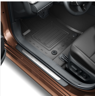
Guminiai grindų kilimėliai Kaina - nuo 196€ Mėnesio įmoka nuo 3€/per mėnesį