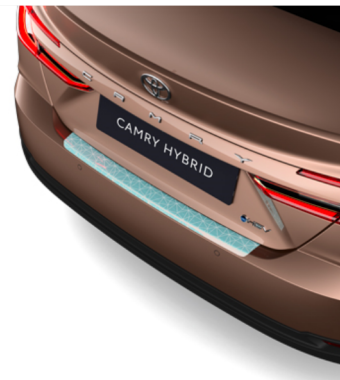
Galinio buferio apsauginė plėvelė Kaina - nuo 117€ Mėnesio įmoka nuo 2€/per mėnesį