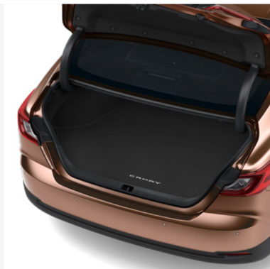
Tekstilinis bagažo kilimėlis Kaina - nuo 153€ Mėnesio įmoka nuo 2€/per mėnesį