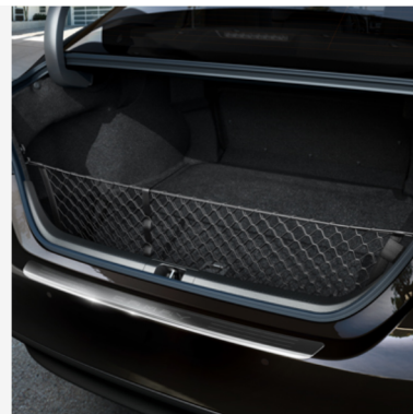
Krovinių tvirtinimo tinklėlis (vertikalus) Kaina - nuo 81€ Mėnesio įmoka nuo 1€/per mėnesį