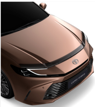
Variklio dangčio deflektorius Kaina - nuo 207€ Mėnesio įmoka nuo 3€/per mėnesį