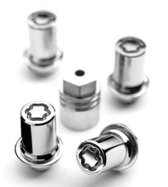
Rato užrakto veržlė Kaina - nuo 73€ Mėnesio įmoka nuo 1€/per mėnesį

Į kainą įeina PVM ir montavimas, išskyrus žieminės padangas su lengvojo lydinio ratlankiais, kurių montavimo mokestis taikomas atskirai. Kainos skirtingose atstovybėse gali skirtis. Norėdami patikslinti dėl turimos papildomos įrangos ir kainų, kreipkitės į artimiausią Toyota atstovybę. Mėnesinė įmoka už papildomą įrangą galioja ją įsigyjant kartu su nauju automobiliu.