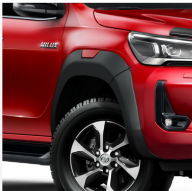
Sparnų apsauga su raudonu intarpu Kaina - nuo 614€ Mėnesio įmoka nuo 10€/per