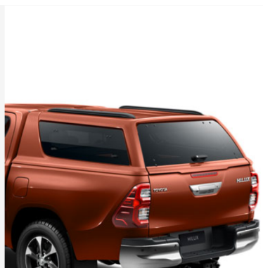
Laisvalaikui skirtas kietas krovinų skyriaus dangtis Double Cab modeliui (Orange me (4R8)) Kaina - nuo 4438€