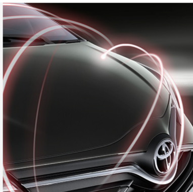
Ilgalaikė kėbulo apsauga Kaina - nuo 392€ Mėnesio įmoka nuo 6€/per mėnesį