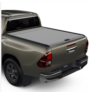
Aliumininis užtraukiamas krovinų skyriaus uždangalas Kaina - nuo 2985€ Mėnesio įmoka nuo 49€/per