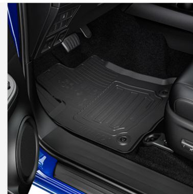
Guminiai grindų kilimėliai Kaina - nuo 124€ Mėnesio įmoka nuo 2€/per mėnesį