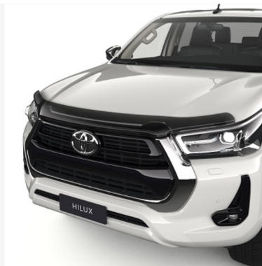
Variklio dangčio deflektorius Kaina - nuo 230€ Mėnesio įmoka nuo 4€/per mėnesį