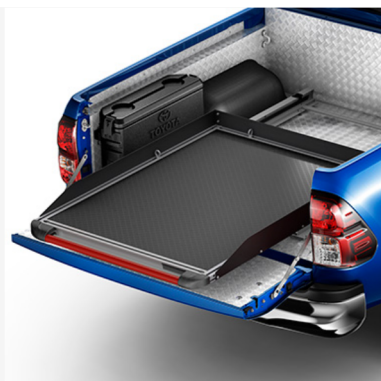
Slankiojamasis krovinų skyriaus pagrindas Kaina - nuo 2854€ Mėnesio įmoka nuo 47€/per