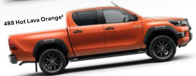
4R8 Hot Lava Orange §