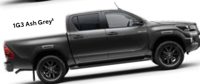
1G3 Ash Grey §