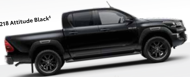
218 Attitude Black §