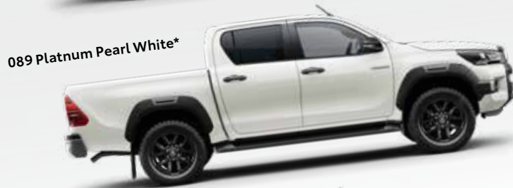
089 Platnum Pearl White*