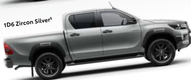
1D6 Zircon Silver §