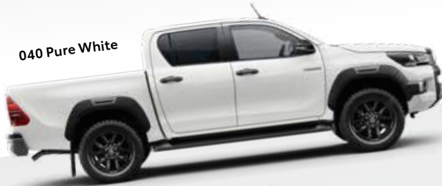
040 Pure White