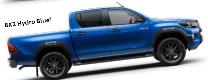
8X2 Hydro Blue §