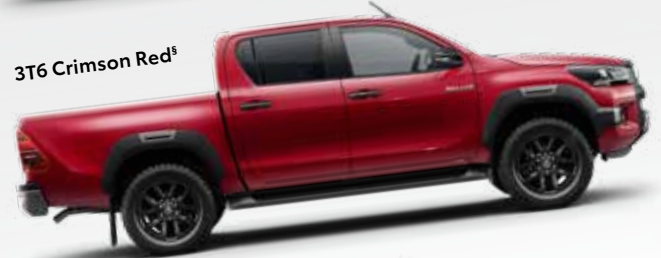
3T6 Crimson Red §