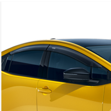
Vėjo deflektoriai Kaina - nuo 249€ Mėnesio įmoka nuo 4€/per mėnesį