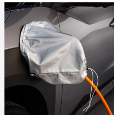
Įkrovimo lizdo dangtelis Kaina - nuo 55€ Mėnesio įmoka nuo 1€/per mėnesį

Į kainą įeina PVM ir montavimas, išskyrus žieminės padangas su lengvojo lydinio ratlankiais, kurių montavimo mokestis taikomas atskirai. Kainos skirtingose atstovybėse gali skirtis. Norėdami patikslinti dėl turimos papildomos įrangos ir kainų, kreipkitės į artimiausią Toyota atstovybę. Mėnesinė įmoka už papildomą įrangą galioja ją įsigyjant kartu su nauju automobiliu.