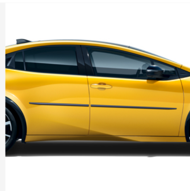
Šoninės apdailos juostelės Kaina - nuo 957€ Mėnesio įmoka nuo 14€/per mėnesį