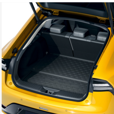
Bagazinės įklotas Kaina - nuo 97€ Mėnesio įmoka nuo 1€/per mėnesį