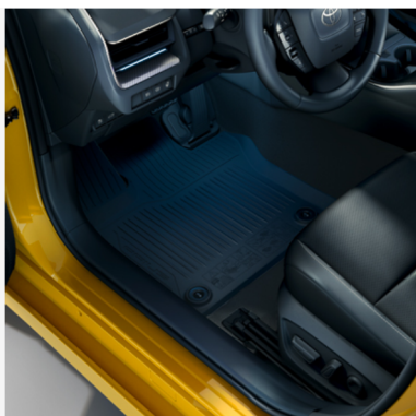
Guminiai grindų kilimėliai Kaina - nuo 136€ Mėnesio įmoka nuo 2€/per mėnesį