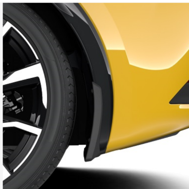
Priekiniai ir galiniai purvasaugiai Kaina - nuo 243€ Mėnesio įmoka nuo 4€/per mėnesį