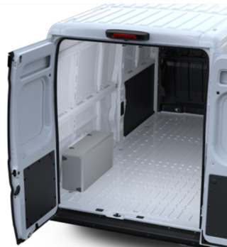
Rato arkos gaubto rinkinys - polipropileno Kaina - nuo 257€ Mėnesio įmoka nuo 4€/per mėnesį