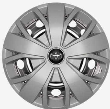
Rato gaubtai 16" Kaina - nuo 283€ Mėnesio įmoka nuo 4€/per mėnesį