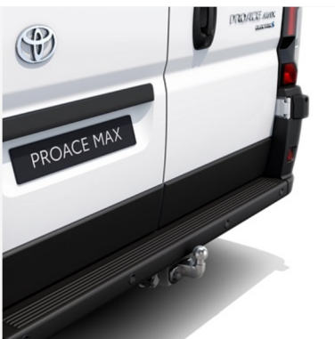
Flanšinis vilkimo įtaisas Kaina - nuo 1402€ Mėnesio įmoka nuo 22€/per mėnesį