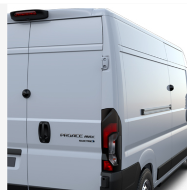
Apsauginis durelių užraktas Kaina - nuo 854€ Mėnesio įmoka nuo 13€/per mėnesį

Į kainą įeina PVM ir montavimas, išskyrus žieminės padangas su lengvojo lydinio ratlankiais, kurių montavimo mokestis taikomas atskirai. Kainos skirtingose atstovybėse gali skirtis. Norėdami patikslinti dėl turimos papildomos įrangos ir kainų, kreipkitės į artimiausią Toyota atstovybę. Mėnesinė įmoka už papildomą įrangą galioja ją įsigyjant kartu su nauju automobiliu.