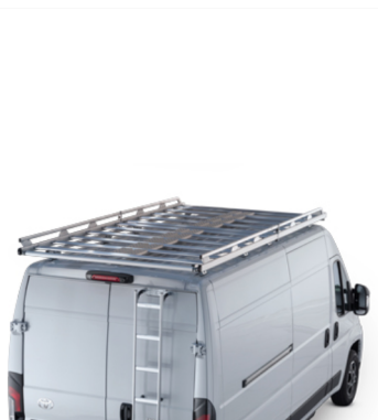
Stogo platforma Kaina - nuo 4059€ Mėnesio įmoka nuo 63€/per mėnesį