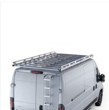
Kopėčios Kaina - nuo 919€ Mėnesio įmoka nuo 14€/per mėnesį