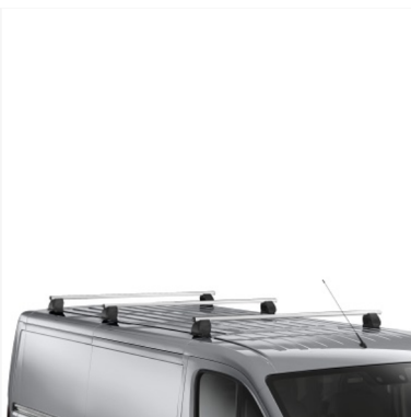
Stogo skersiniai laikikliai Kaina - nuo 535€ Mėnesio įmoka nuo 8€/per mėnesį