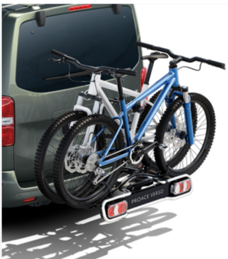
Galinis dviračio laikiklis, montuojamas ant vilkimo rutulio Kaina - nuo 884€ Mėnesio įmoka nuo 14€/per