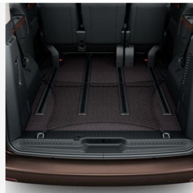
Krovinių tvirtinimo tinklėlis (horizontalus) Kaina - nuo 54€ Mėnesio įmoka nuo 1€/per mėnesį