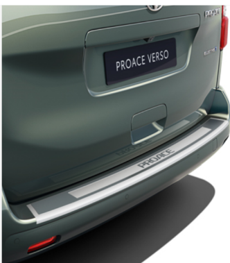
Metalinė galinio buferio apsauginė plokštelė Kaina - nuo 192€ Mėnesio įmoka nuo 3€/per mėnesį