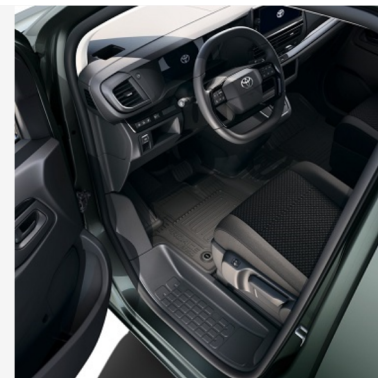
Guminiai grindų kilimėliai Kaina - nuo 93€ Mėnesio įmoka nuo 1€/per mėnesį