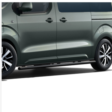
Šoninės apdailos juostelės Kaina - nuo 1136€ Mėnesio įmoka nuo 18€/per mėnesį