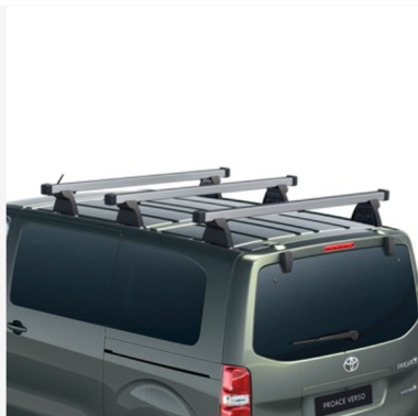
Stogo skersiniai laikikliai Kaina - nuo 284€ Mėnesio įmoka nuo 4€/per mėnesį