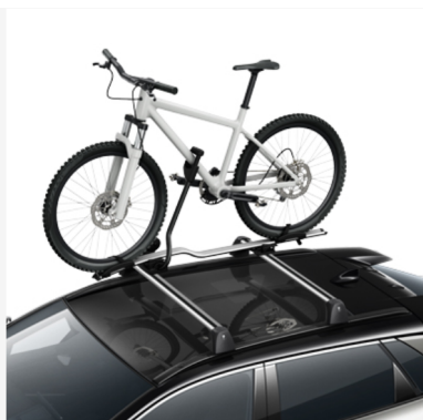
Dviračių laikiklis Kaina - nuo 233€ Mėnesio įmoka nuo 4€/per mėnesį