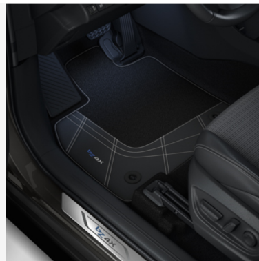
Tekstilinis ir odinis grindų kilimėlis, 830 g Kaina - nuo 184€ Mėnesio įmoka nuo 3€/per mėnesį