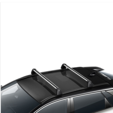
Stogo bagažinės skersiniai laikikliai Kaina - nuo 359€ Mėnesio įmoka nuo 6€/per mėnesį