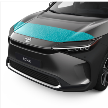
Variklio skyriaus dangčio apsauginė plėvelė Kaina - nuo 259€ Mėnesio įmoka nuo 4€/per mėnesį