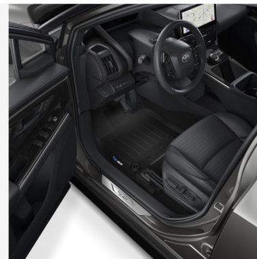
Guminiai grindų kilimėliai Kaina - nuo 123€ Mėnesio įmoka nuo 2€/per mėnesį