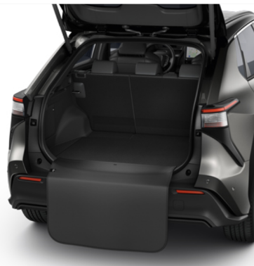
Galinio buferio apsauga Kaina - nuo 107€ Mėnesio įmoka nuo 2€/per mėnesį